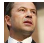
Тіріпко пояснив, як гривню