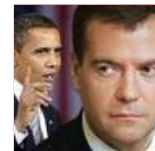
Пристрасть набула нових форм!